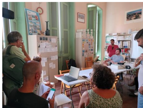
Imagen 3.- Foto de grupo de la primera reunión de coordinación y un momento de la mesa de trabajo