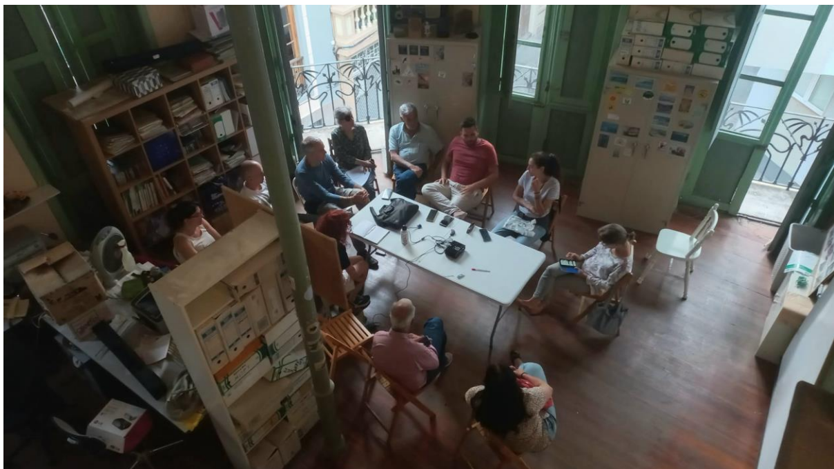
Imagen 1.- asamblea general del 28 de marzo

Se han realizado una por mes coincidiendo casi siempre con el primer martes, a ellas acude cualquier socio o ciudadano que quiera trasladarnos sus preocupaciones medioambientales.