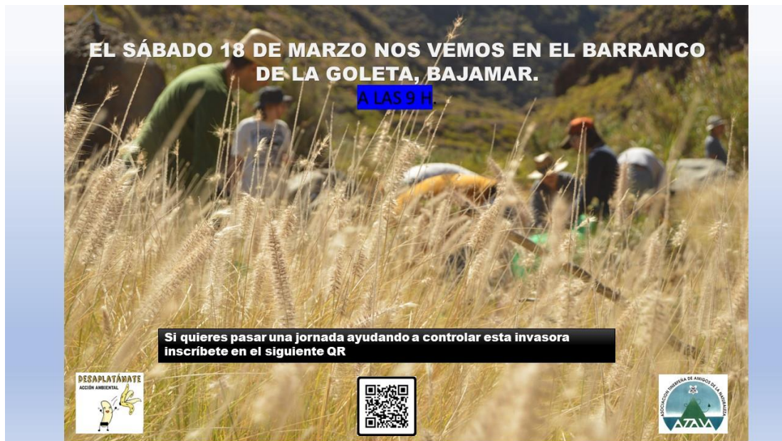
Imagen 5.- Modelo de cartel para la convocatoria mensual.