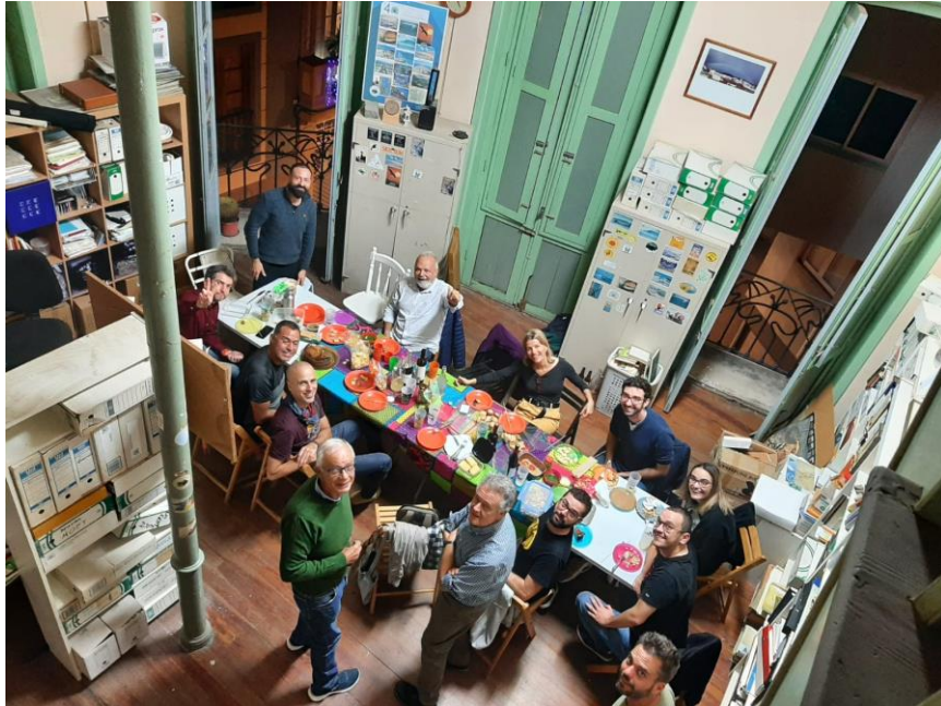
Imagen 2.- Vista aérea del grupo navideño

Por fin se retomó este evento, este año fuimos más de 20, entre socios y simpatizantes y pasamos un buen rato, incluso se oyó algún villancico.