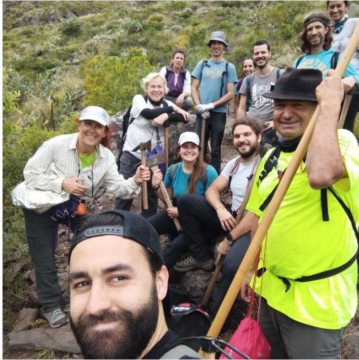
Imagen 4.- Nutrido grupo de la salida del mes de marzo