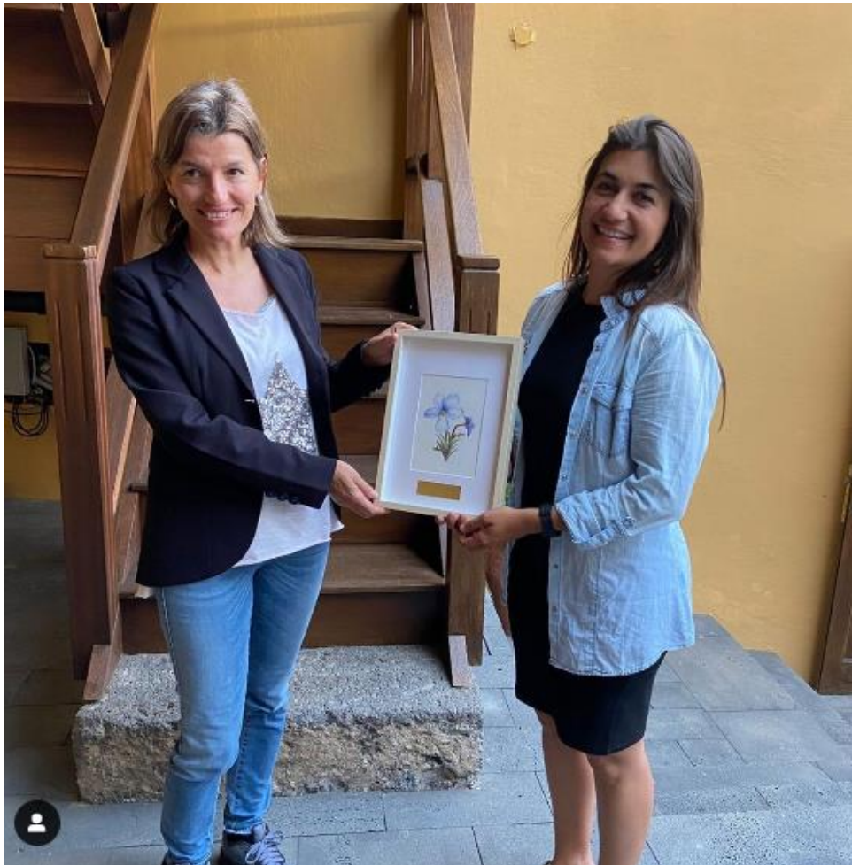
Imagen 7.- Momento de la entrega del premio Violeta de Oro 2023