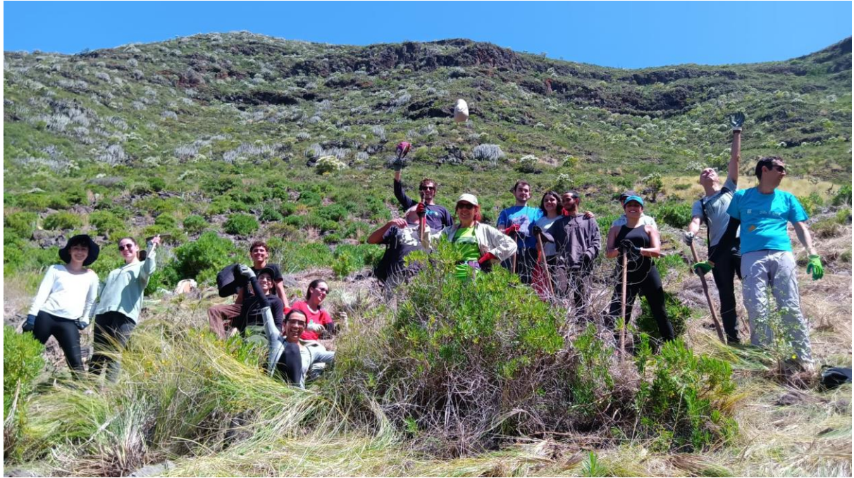
Imagen 6.- Grupo participante de la jornada de abril